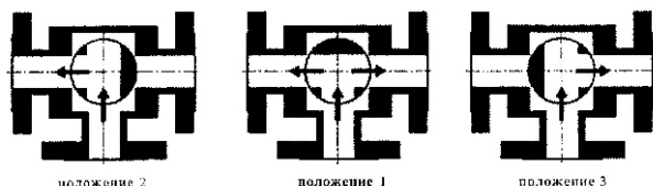
Режим работы крана с Т-образной пробкой